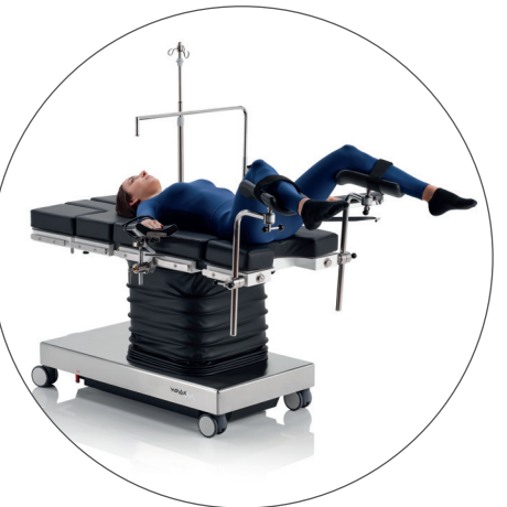
Position de lithotomie